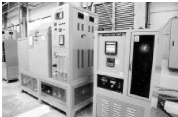
エイジロン

また、本年7月29日、(社)日本下水道協会、下水道展と共催の下水道研究発表会(横浜)にて、10月29日、日本材料学会、アップグレードシンポジウム(京都)にて、業務の一部を発表する予定にしています。