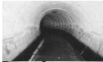
写真1 一種のCCFRPMの施工状況(上 内部、下 地上)